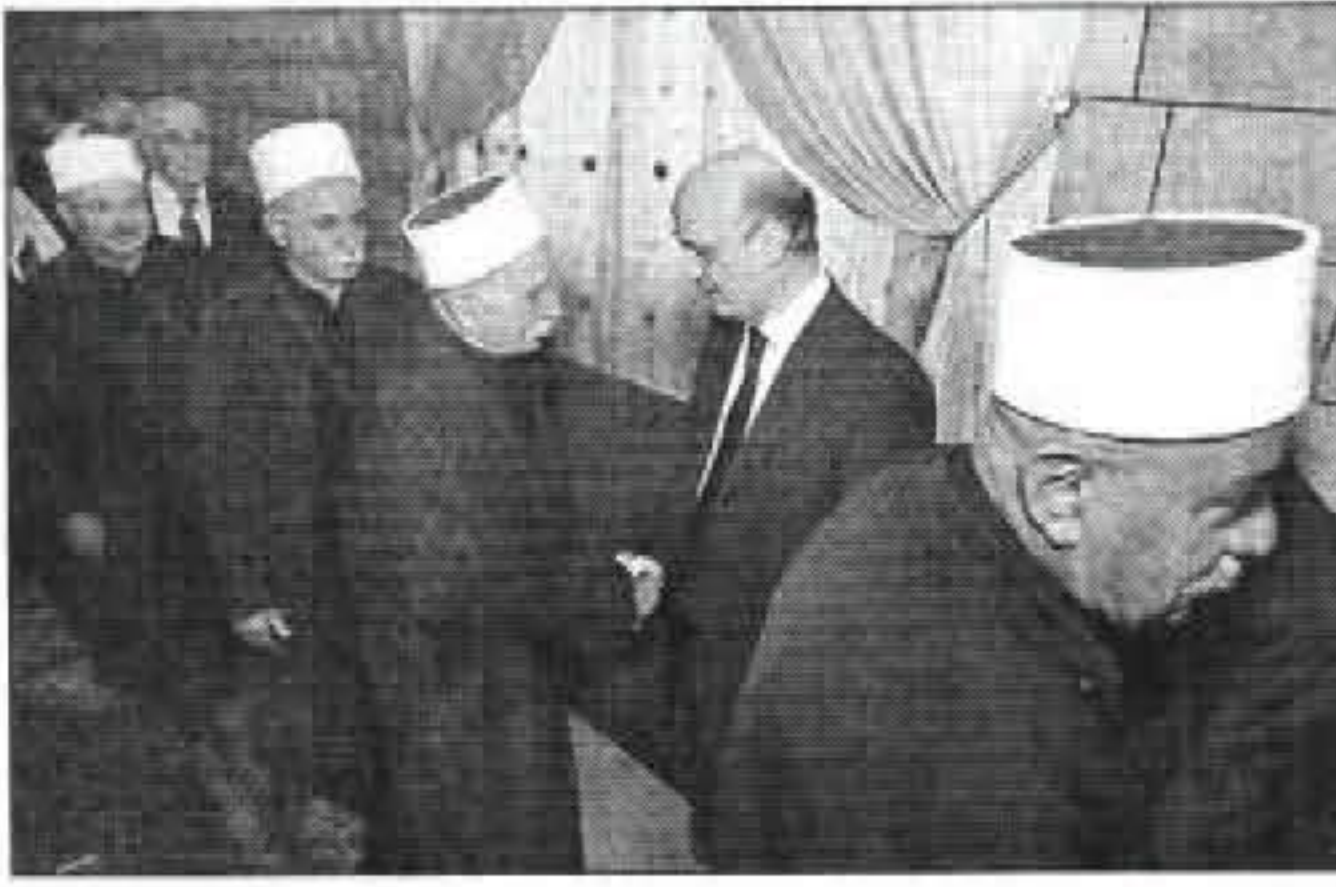
الدكتور جعجع يتقبل تعازي مشايخ الدرّوز